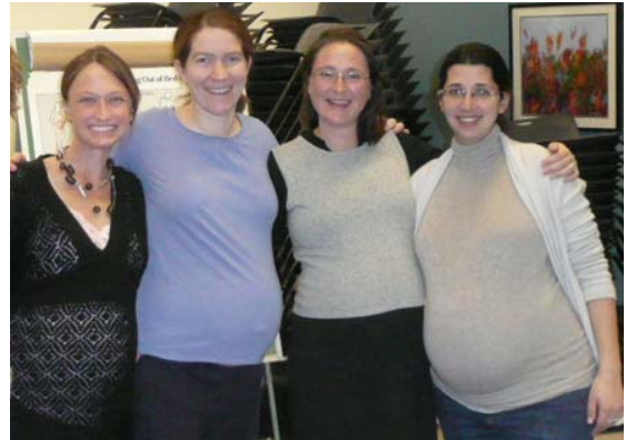
Blivande mammor i child birth preparation-gänget